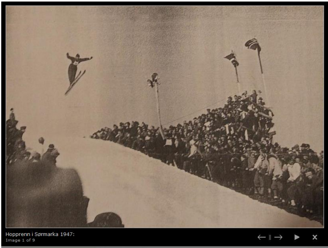
Hopprenn i Sørmarka 1947: Image 1 of 9